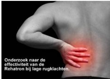
Onderzoek naar de effectiviteit van de Rehatron bij lage rugklachten.

Veel mensen houden last van hun rug omdat de oorzaak niet wordt aangepakt.